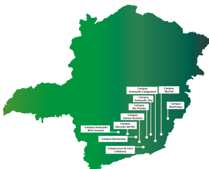
FIGURA 1. Mapa com a localização dos campi do IF Sudeste MG

O Instituto Federal de Educação, Ciência e Tecnologia do Sudeste de Minas Gerais (IF Sudeste MG) foi criado em dezembro de 2008, pela Lei Nº 11.892/2008 e integrou, em uma única instituição, o Centro Federal de Educação Tecnológica de Rio Pomba (CEFET-RP), a Escola Agrotécnica Federal de Barbacena e o Colégio Técnico Universitário (CTU) da UFJF. Atualmente, a instituição é composta por campi localizados nas cidades de Barbacena, Cataguases, Juiz de Fora, Manhuaçu, Muriaé, Rio Pomba, Santos Dumont, São João del-Rei, Ubá e pelo Campus Avançado em Bom Sucesso. O município de Juiz de Fora abriga, ainda, a Reitoria do instituto.