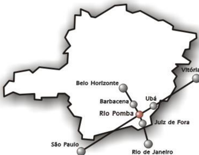
FIGURA 2 – Localização do município de Rio Pomba.

O Campus Rio Pomba do Instituto Federal de Educação, Ciência e Tecnologia do Sudeste de Minas Gerais (IF Sudeste MG) está situado no município de Rio Pomba, microrregião de Ubá, no centro do eixo Belo Horizonte - São Paulo - Rio de Janeiro - Vitória (Figura 2).