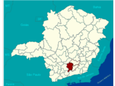
A Região Geográfica Imediata de São João del-Rei (MG).