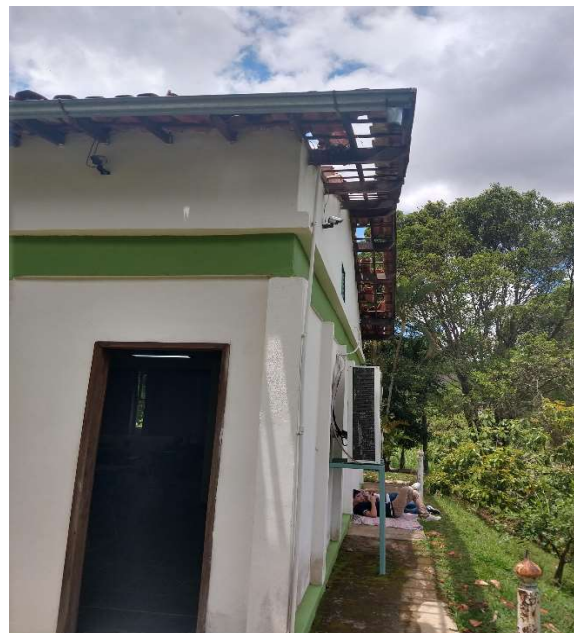
Foto 6 – Beiral do telhado do prédio de sala de aula e biblioteca