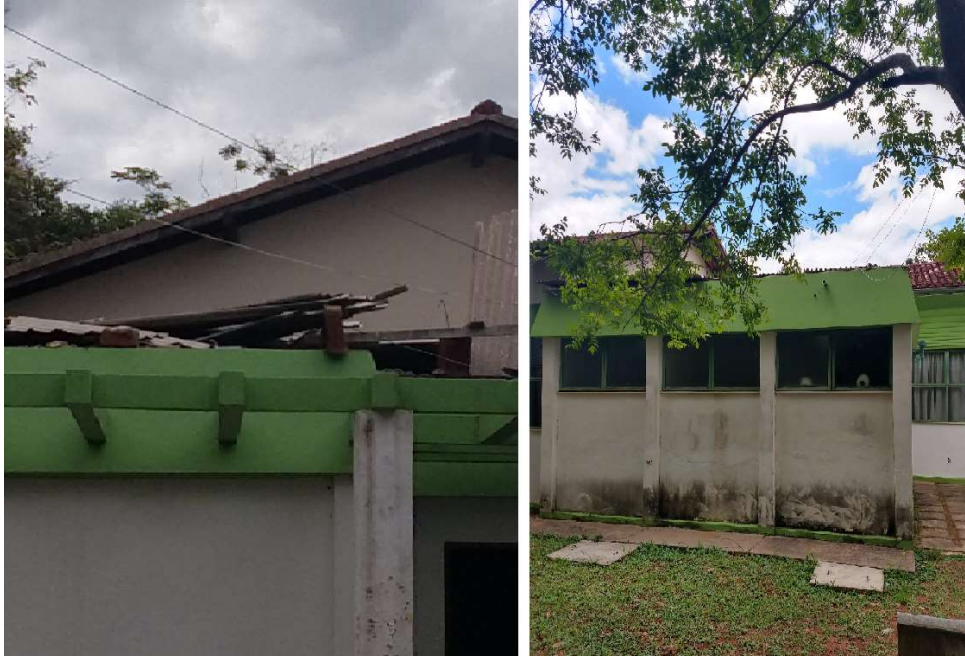
Foto 7 – Telhado dos banheiros do prédio da sala de aula e biblioteca

MINISTÉRIO DA EDUCAÇÃO INSTITUTO FEDERAL DE EDUCAÇÃO, CIÊNCIA E TECNOLOGIA DO SUDESTE DE MINAS GERAIS